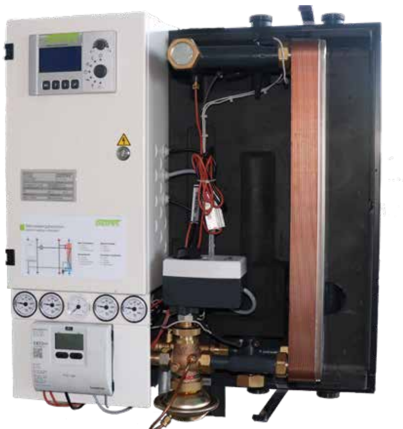
Übergabestation ohne Verkleidung